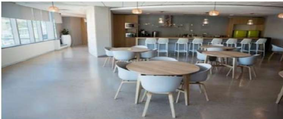
Figura 1- Refeitório- padrões de materiais e acabamentos.

6.3.25. É necessário o fornecimento e a manutenção de mobiliário do refeitório e das copas pelo locador/proprietário do imóvel, conforme padrões de qualidade da AGU e conforme identidade visual ilustrada Manual de Padrões de Ocupação (ver figura 02). As mesas e cadeiras (ver figura 03) devem ser móveis e independentes, sendo necessário no mínimo 150 cadeiras, 26 mesas e 03 espaços para cadeirantes junto à mesas distribuídas pelo espaço do refeitório. As cadeiras devem possuir encosto. As bancadas devem ser em granito ou mármore, devendo todos os elementos listados ou não neste Caderno serem sujeitos à aprovação prévia da AGU.